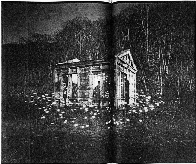
Breathle graph in Yubani 1992. 1169 180x 220mm.