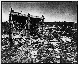
Black and white photograph in Yodanis 1992 #156 1810x 2280px