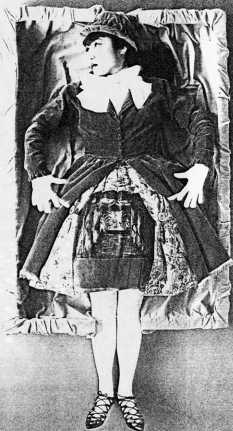
「劇場にて」 1987年 在・アクリル

1957年山形県酒田市生まれ。東京芸術大学卒業後、大学院へ。現在は東京芸術大学美術学部講師。さて、夕張の荒々しい風景に浮かぶ「光」は何でしょう？ その秘密は超・長時間露光。作者本人が光源を持って作品の中を歩き回るといふ四次元的な方法を、巨大な印画紙という平面に収める。しかしながら（本人のお人柄か？）そんな理論はさておいて、穏やかに流れる夕張の「時間」がなごみである。