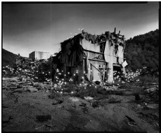
Photograph 100 084254 100

... .. ... .. ... .. ... .. ... .. ... ..