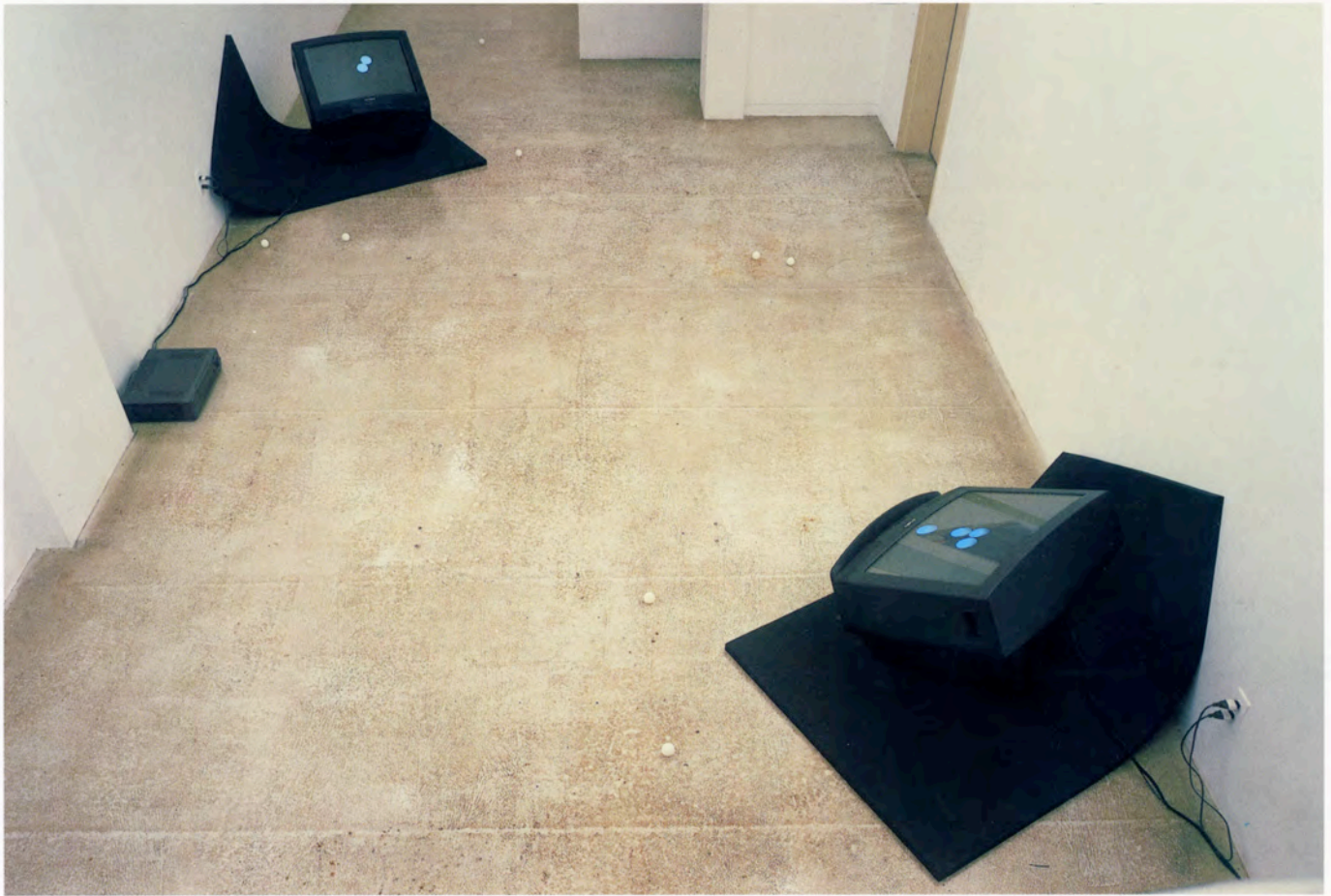
Dropping 2001 AKIYAMA GALLERY