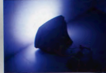
箭内 新一 Shinichi YANAI