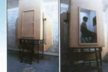
ヘルト・リートフェルト Gert Rietveld (Duende) ・オランダ/The Netherlands