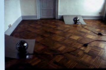
カーチャ・ブット Katja Butt (ドイツ/Germany)