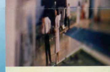
ババック・アフラシャビ Babak Afrassiabi (Duende) ・オランダ/The Netherlands