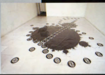
本松 満 Mitsuru MOTOMATSU (W3)