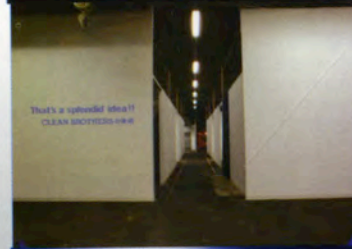
クリーン・ブラザーズ Clean Brothers