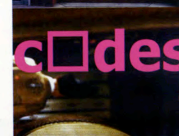
リエフ・ドゥウォント Lieve D'hondt (El Huis) ・ベルギー/Belgium