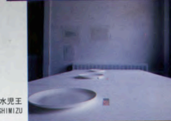
志水 児王 Jio SHIMIZU