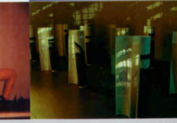
伊藤 洋介 Yusuke ITO (W3)