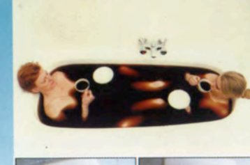
カリーナ・ディペンス Carina Diepens (オランダ/The Netherlands)