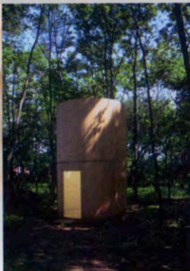
横山 飛鳥 Asuka YOKOYAMA (Fieldwork in Fujino)