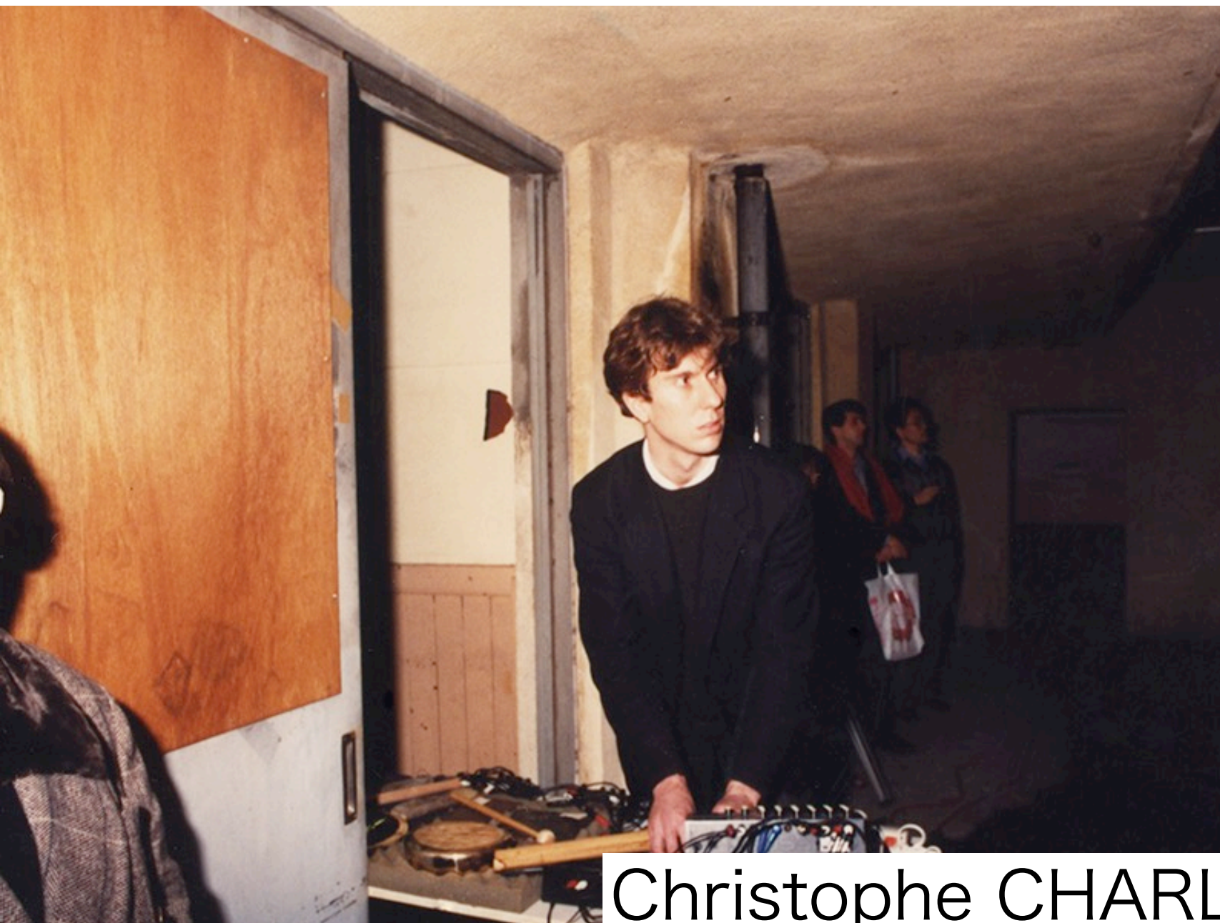
Christophe CHARLES (sound)