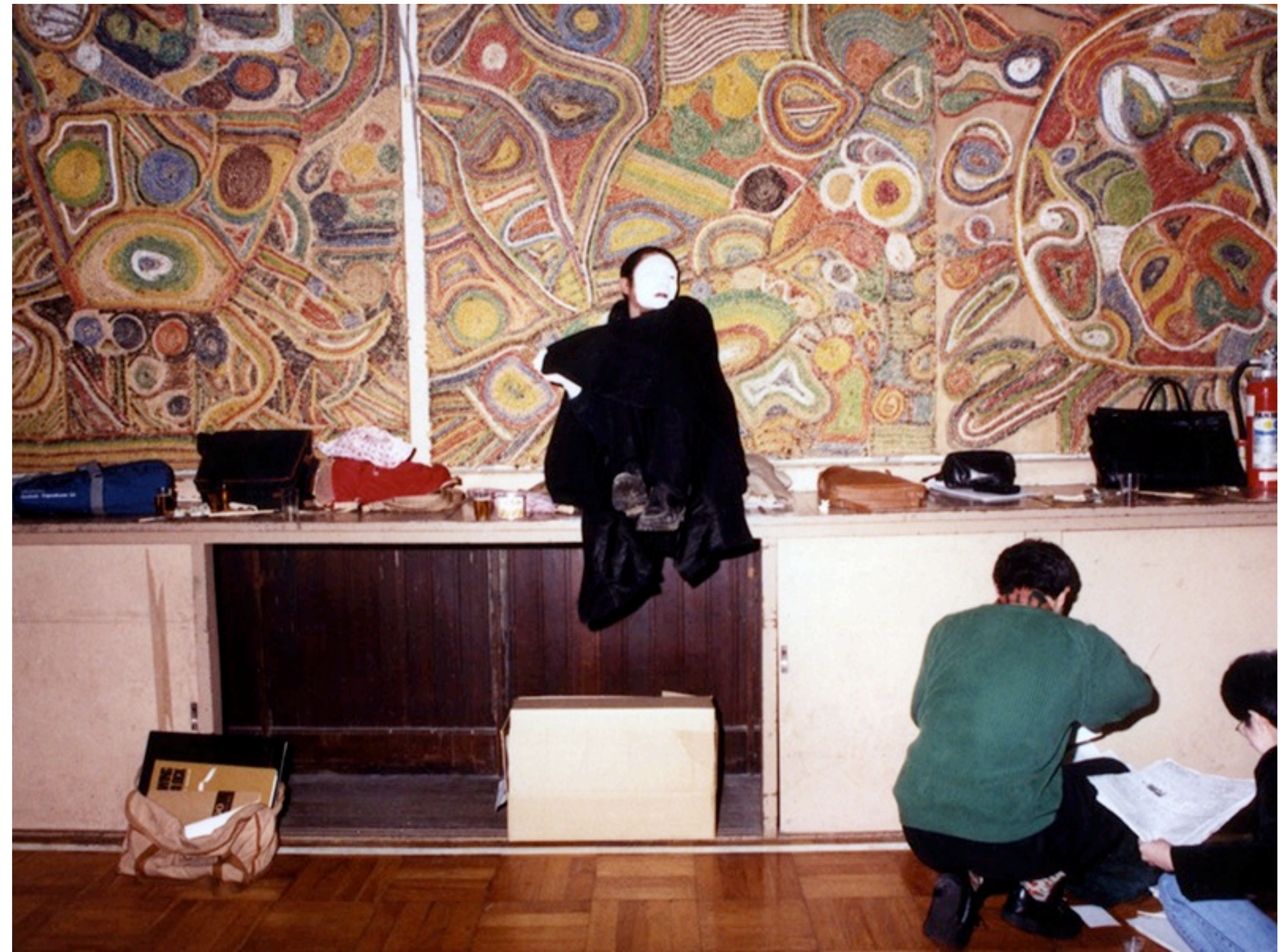
Yufugao Karara ? (buto)